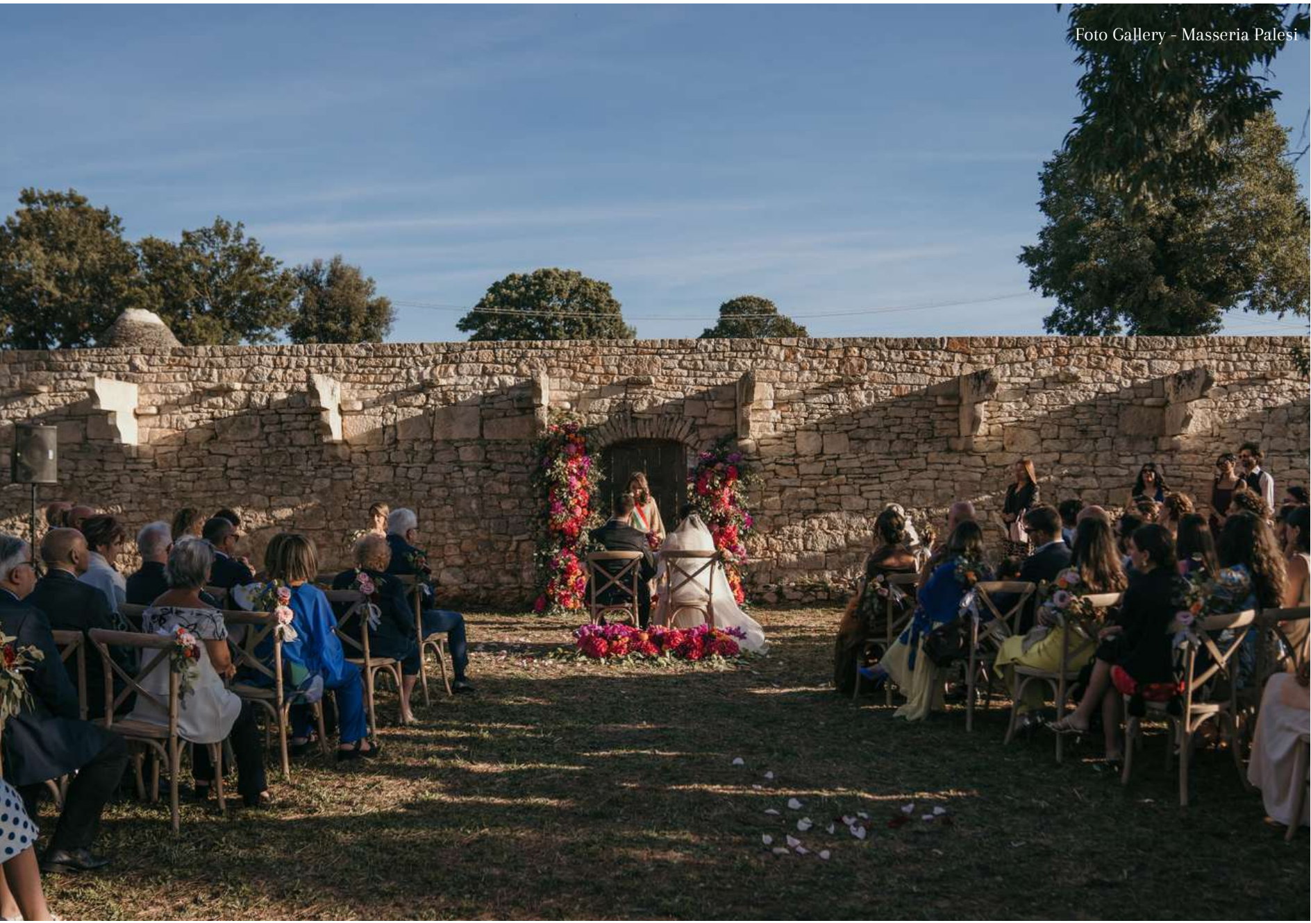
Foto Gallery - Masseria Palesi