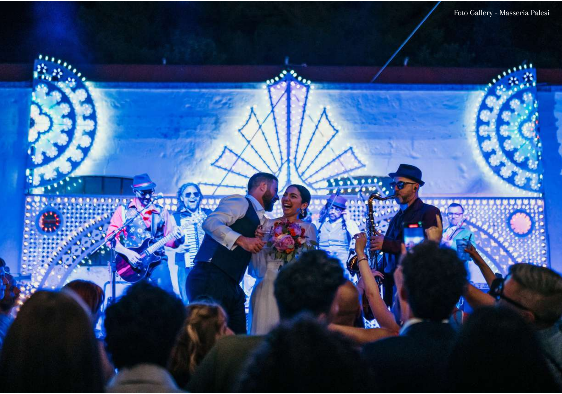
Foto Gallery - Masseria Palesi