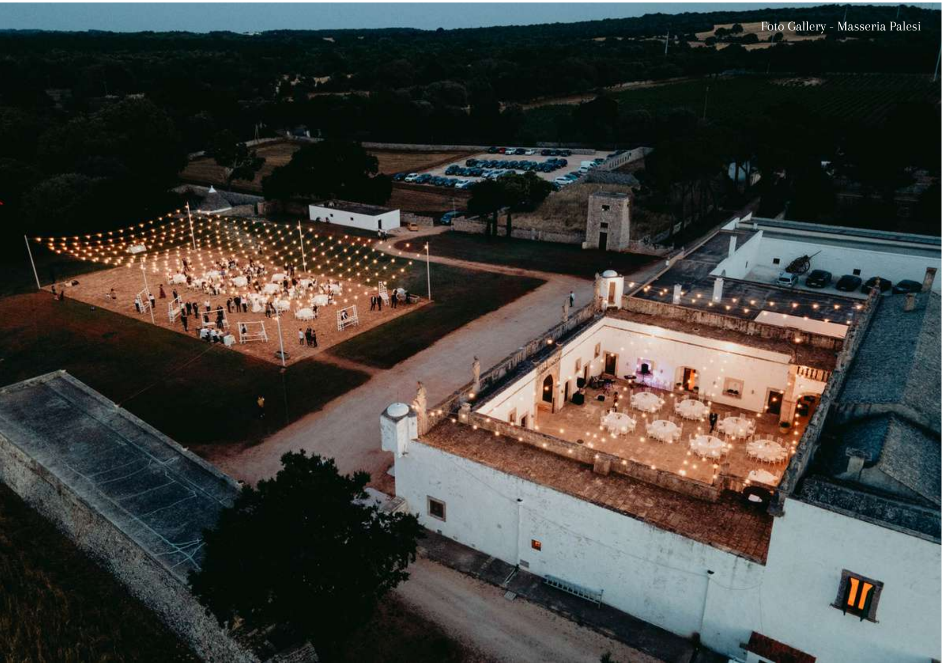
Foto Gallery - Masseria Palesi