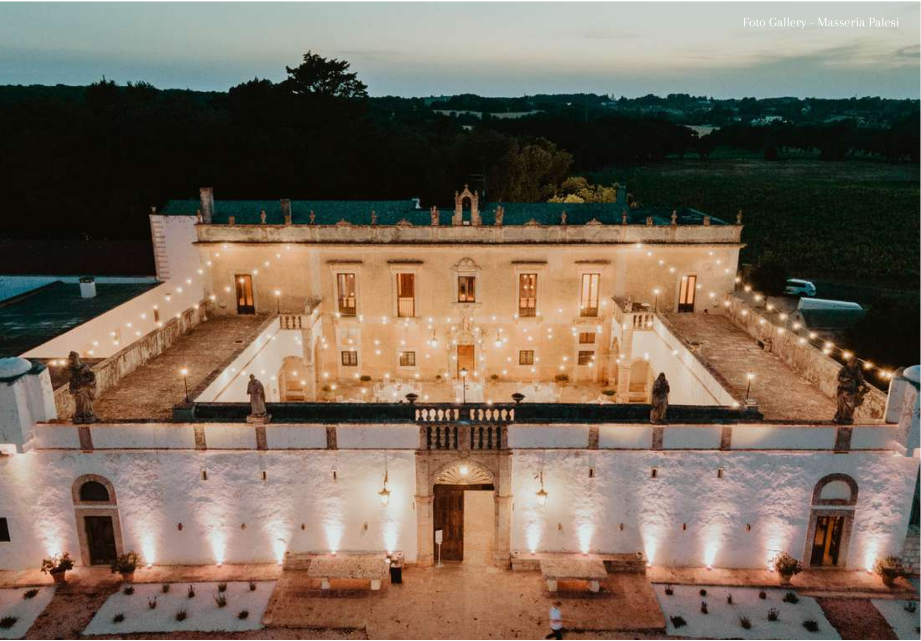
Foto Gallery - Masseria Palesi