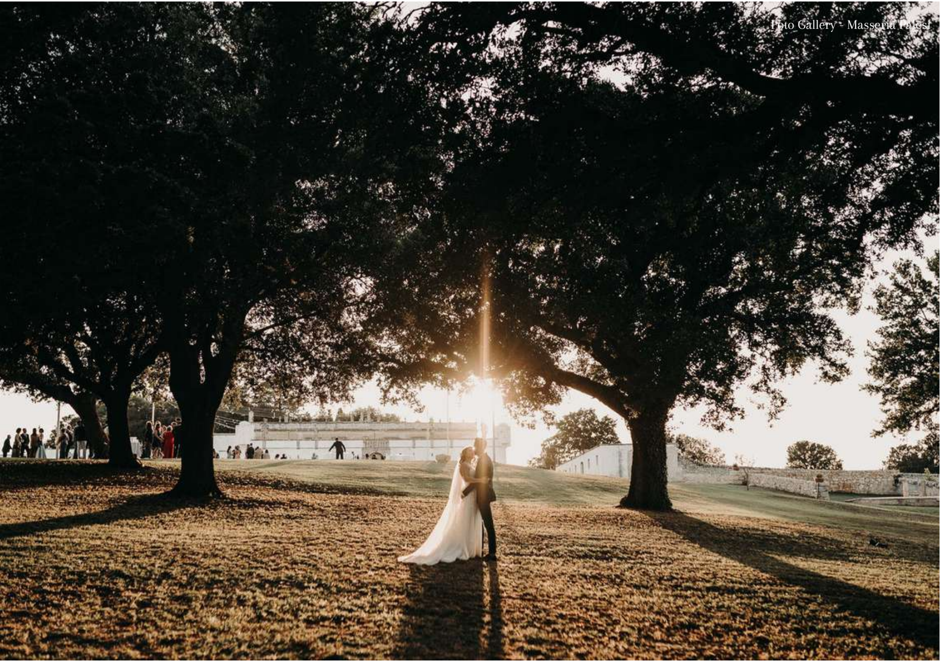
Photo Gallery - Masseria Tulesi