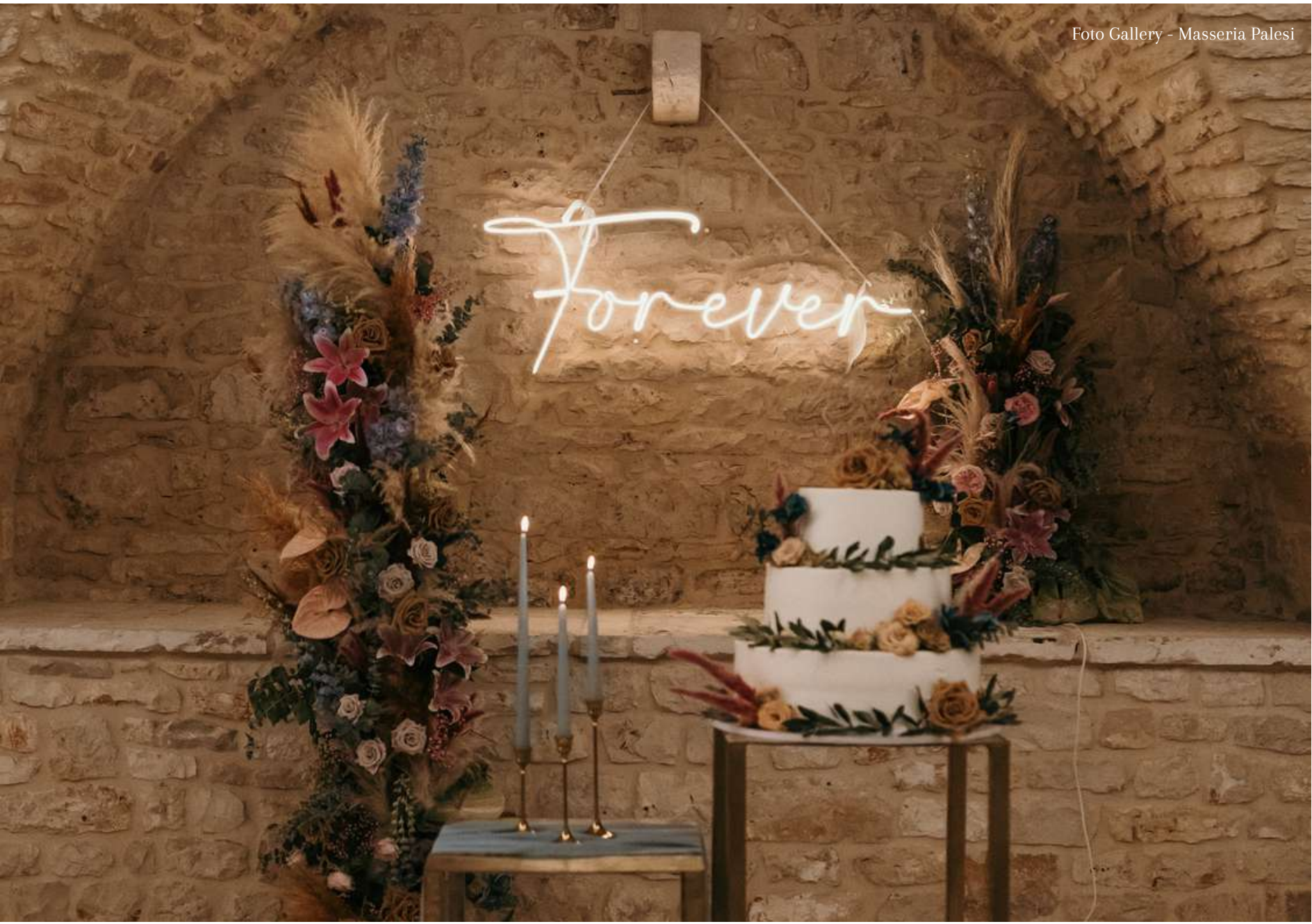
Foto Gallery - Masseria Palesi