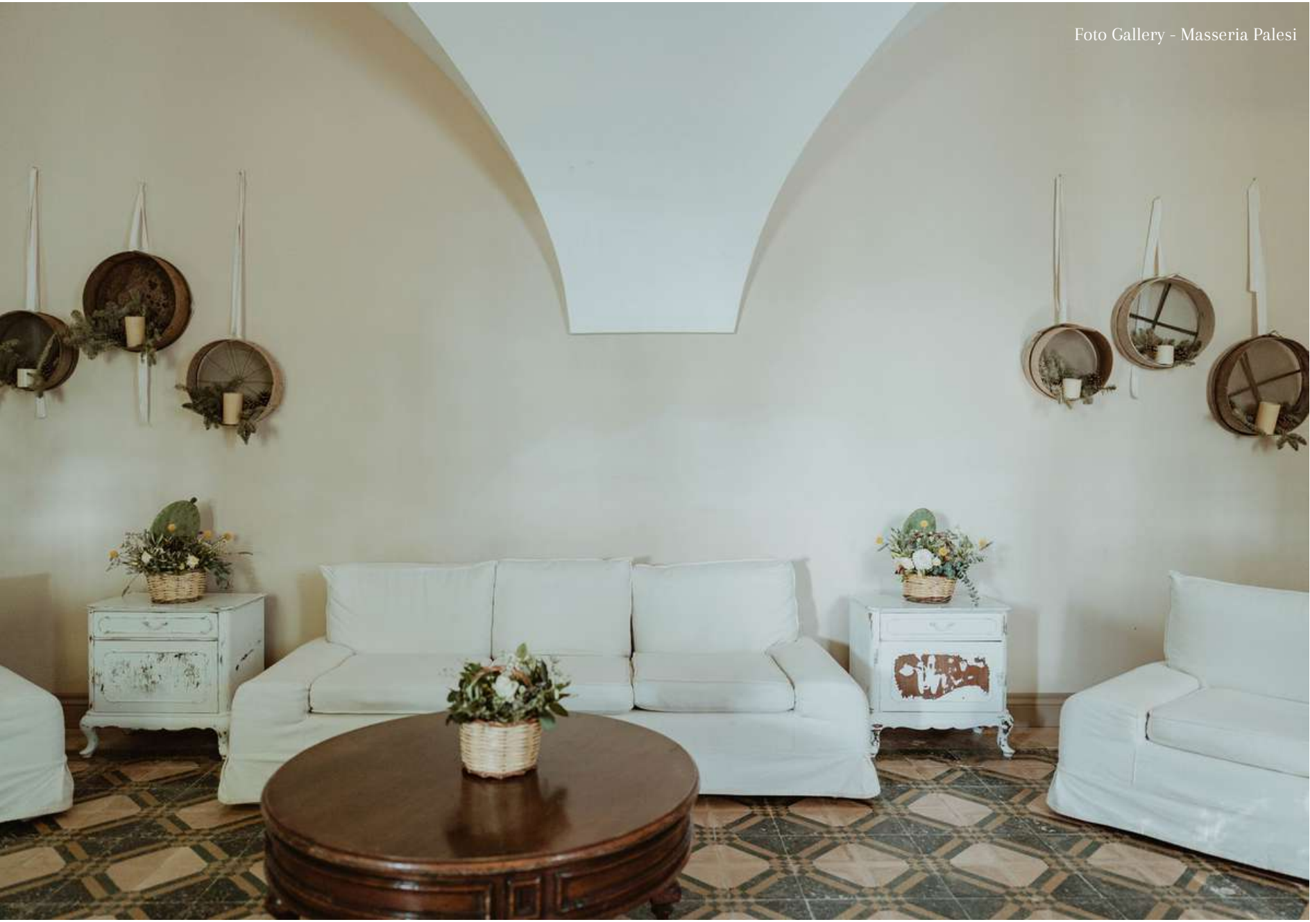
Foto Gallery - Masseria Palesi