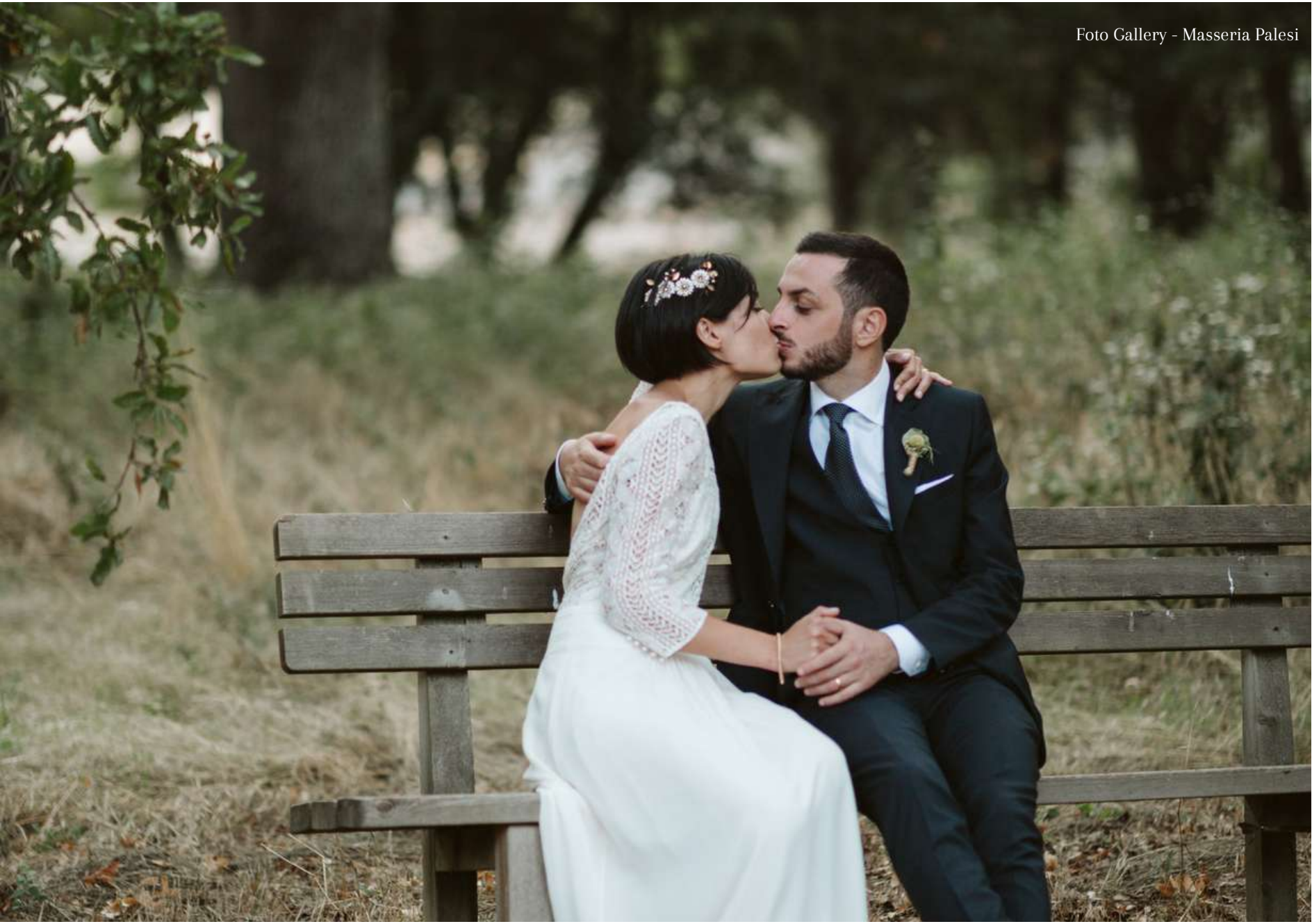
Foto Gallery - Masseria Palesi