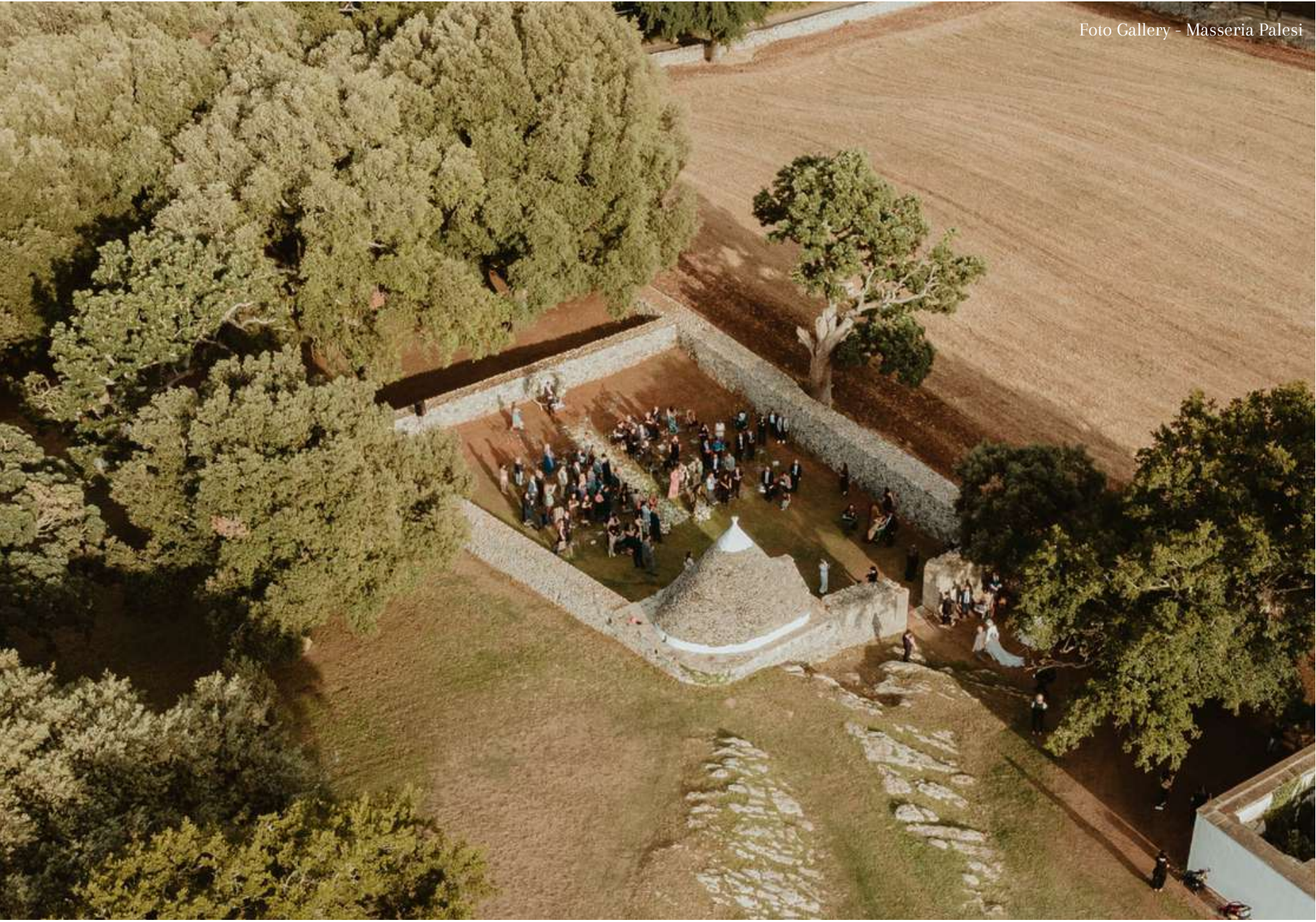
Foto Gallery - Masseria Palesi