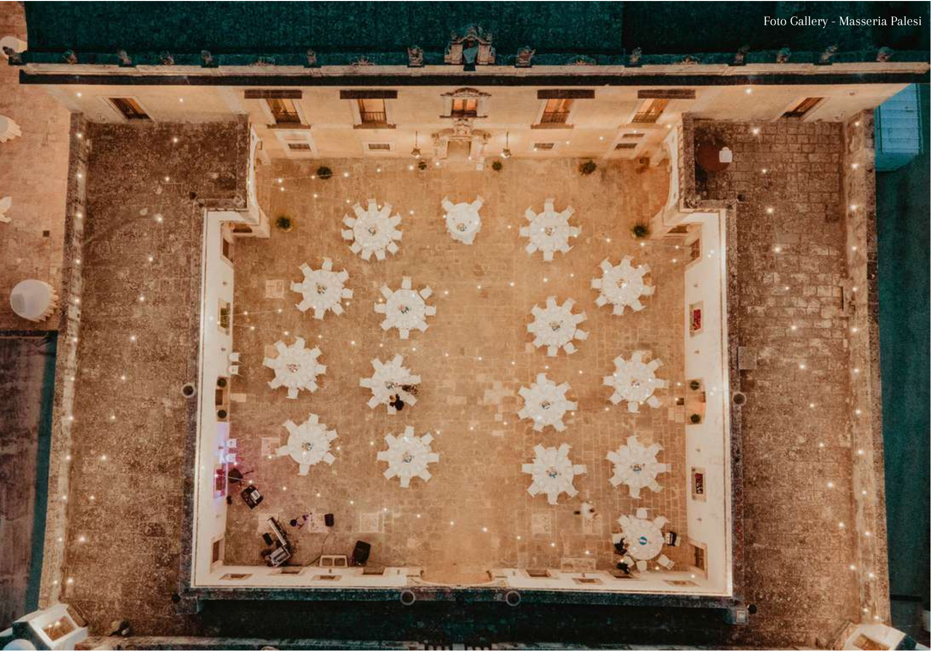
Foto Gallery - Masseria Palesi