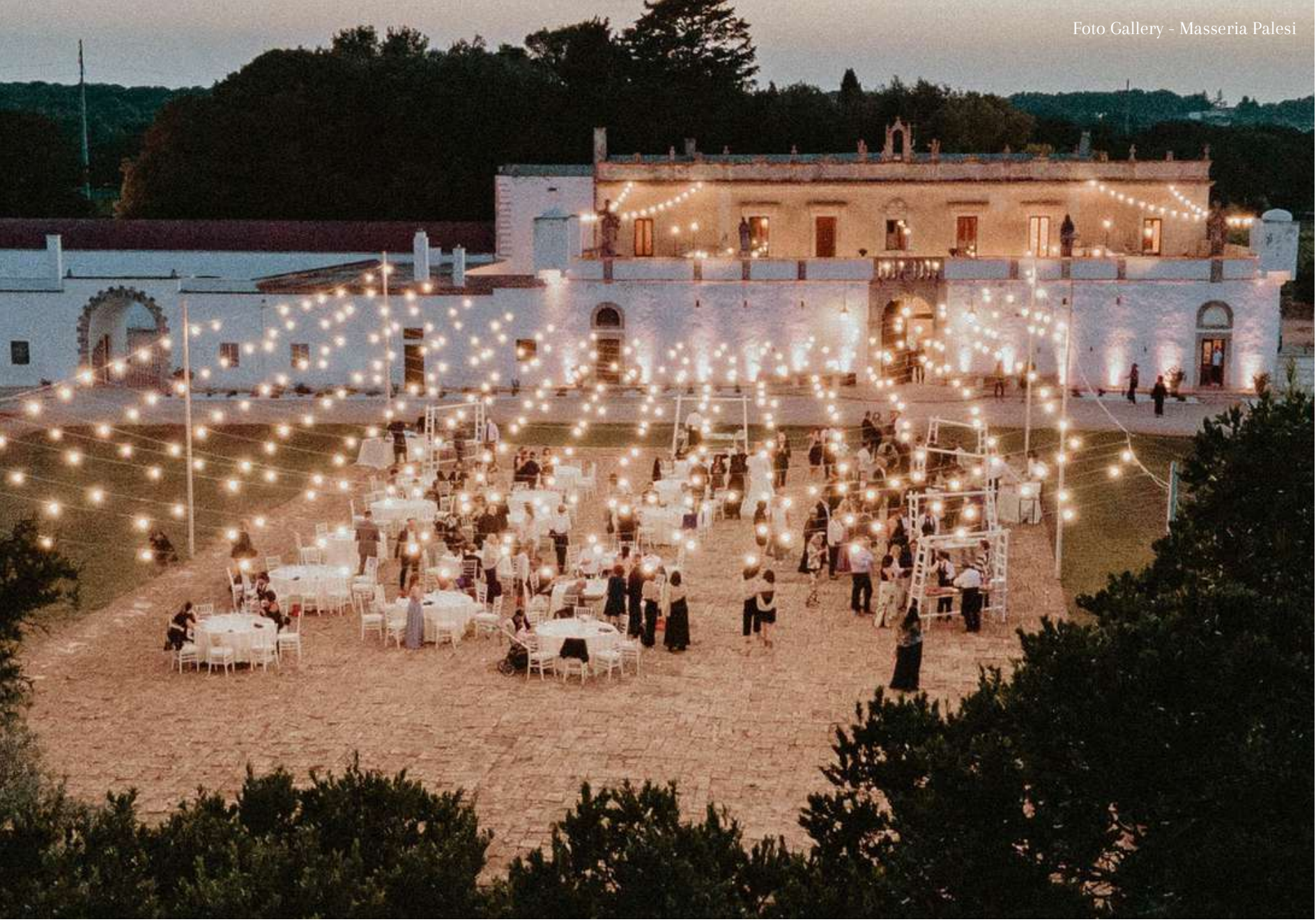
Foto Gallery - Masseria Palesi