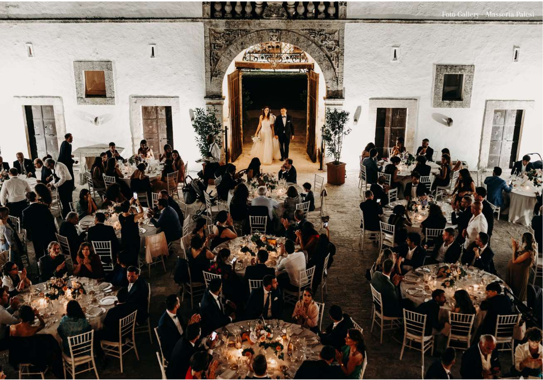
Foto Gallery - Masseria Palosi