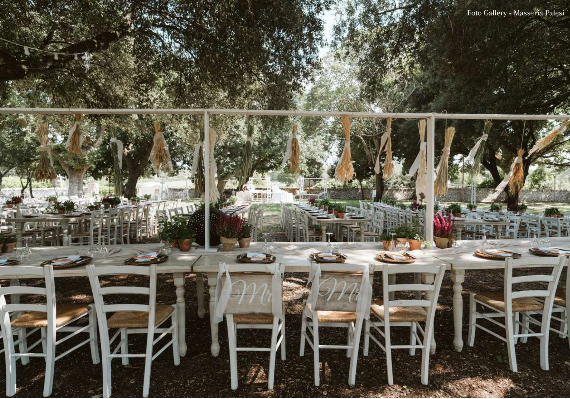
Foto Gallery - Masseria Palesi