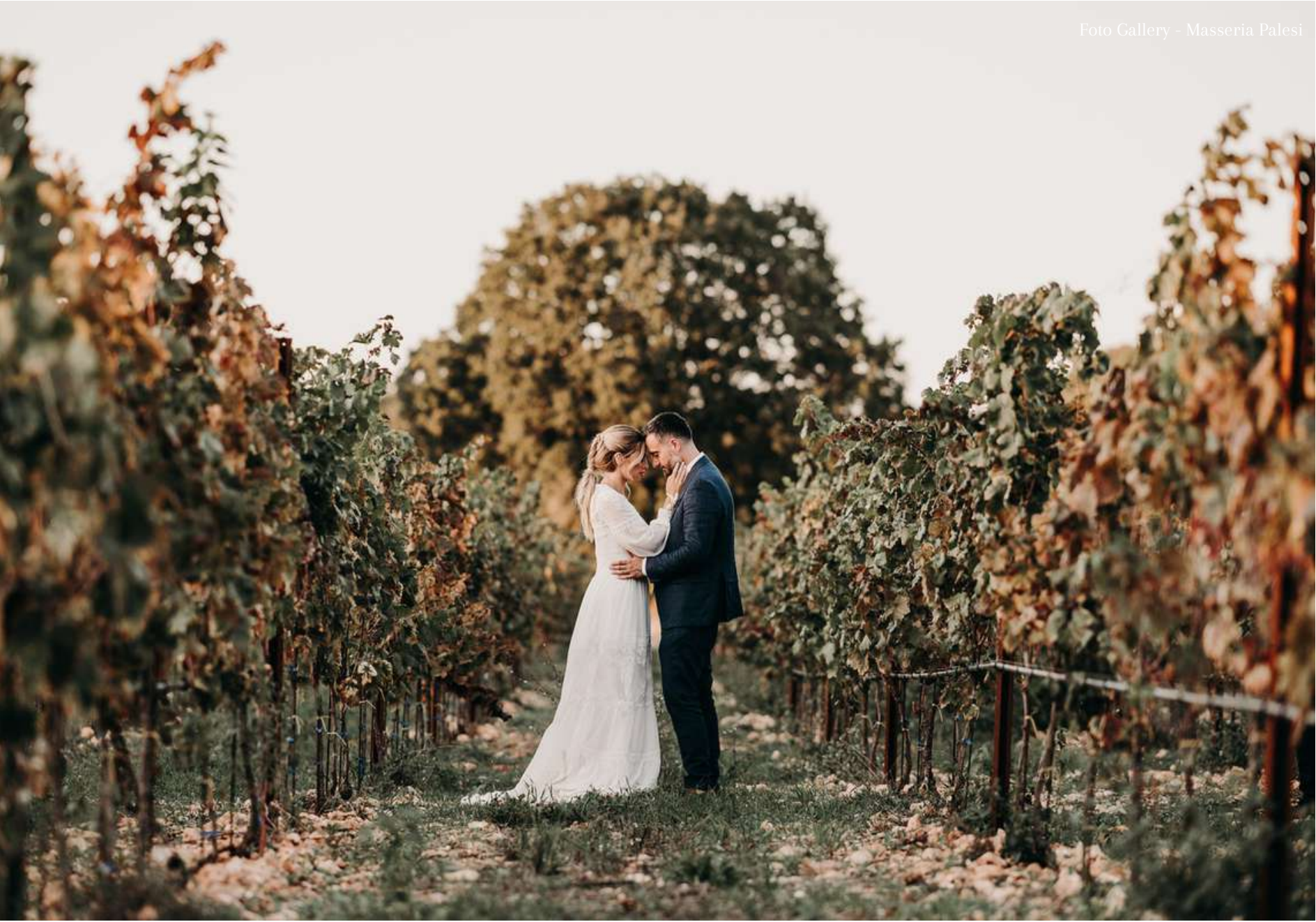
Foto Gallery - Masseria Palesi