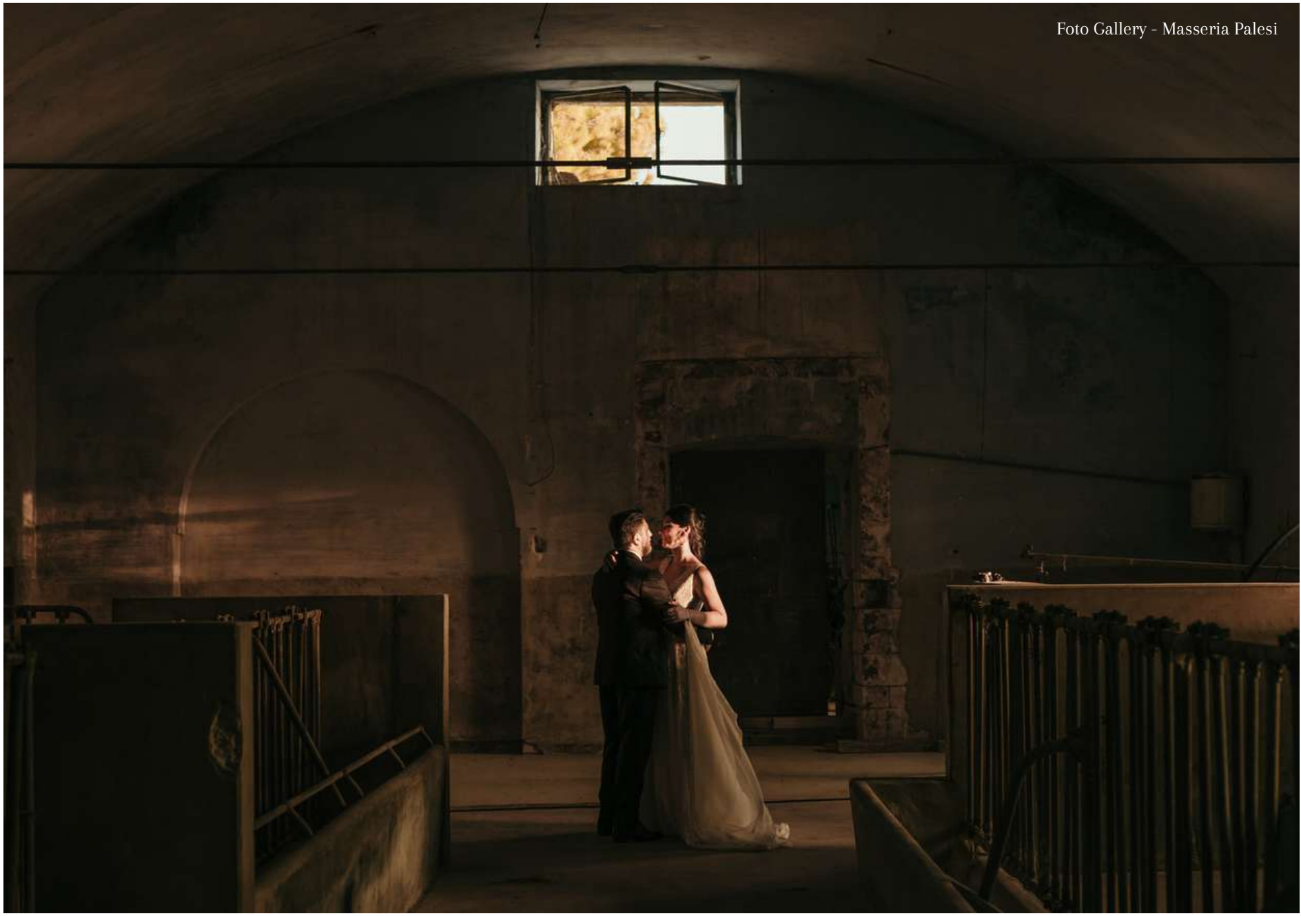
Foto Gallery - Masseria Palesi