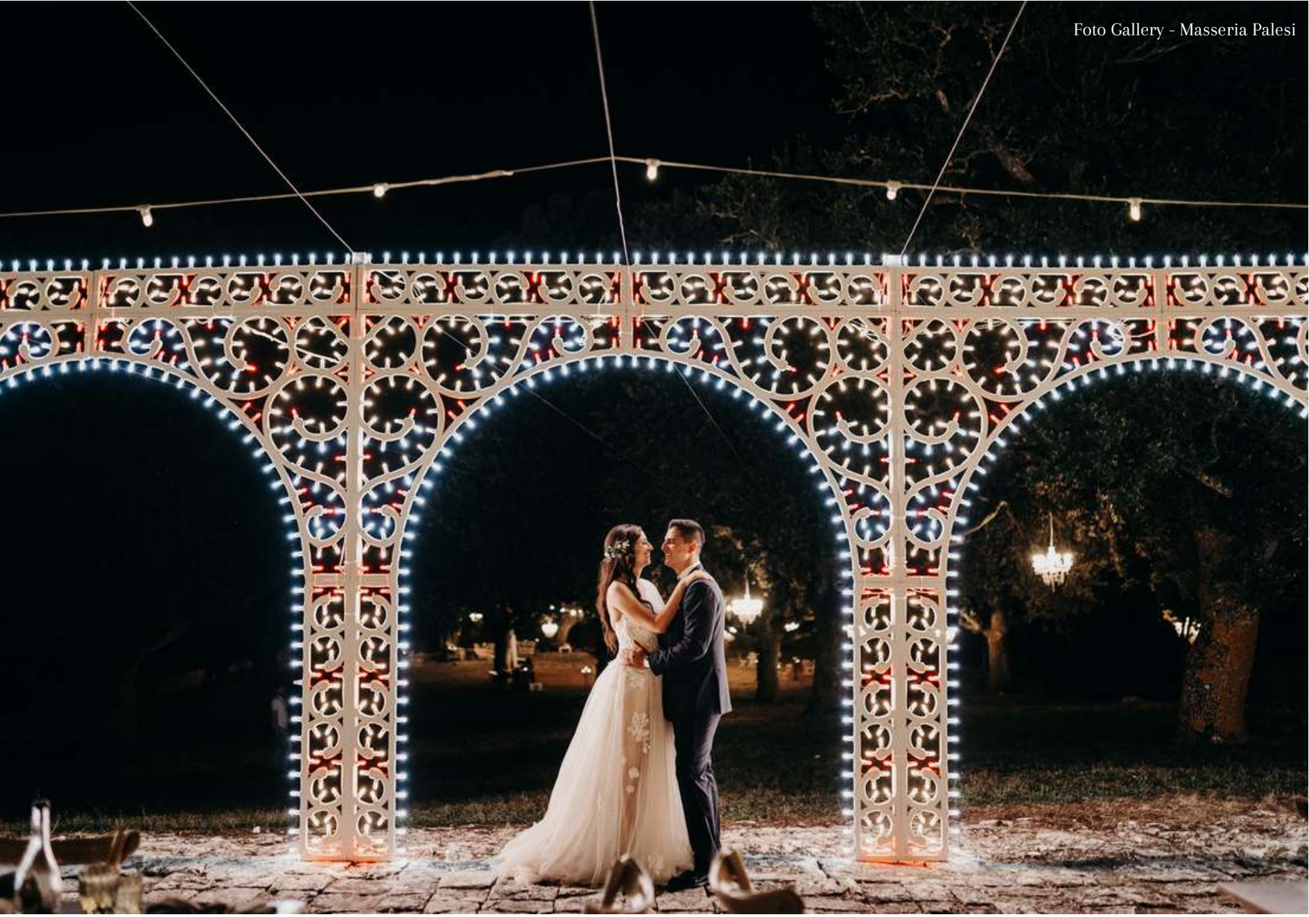
Foto Gallery - Masseria Palesi