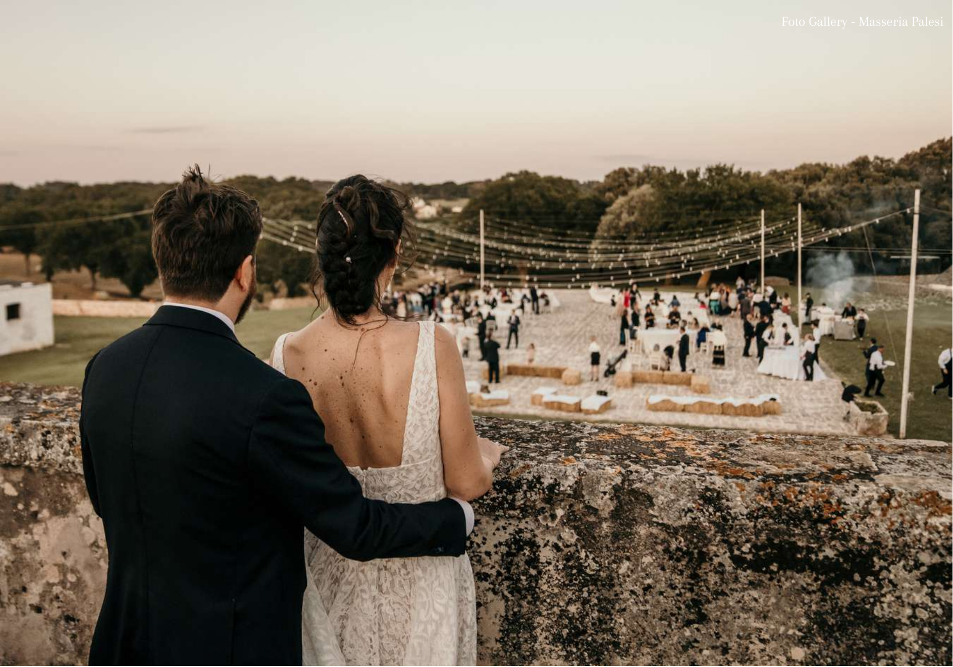
Foto Gallery - Masseria Palesi