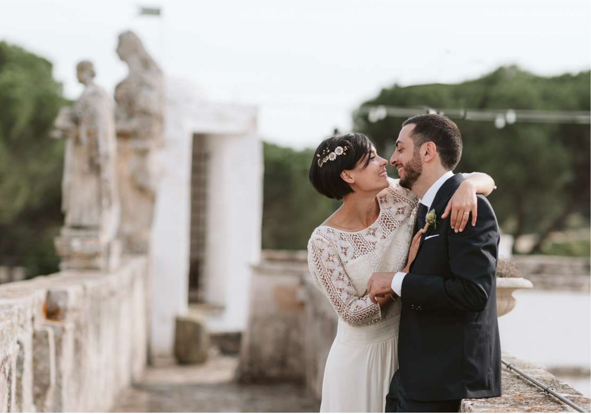
Foto Gallery - Masseria Palafest