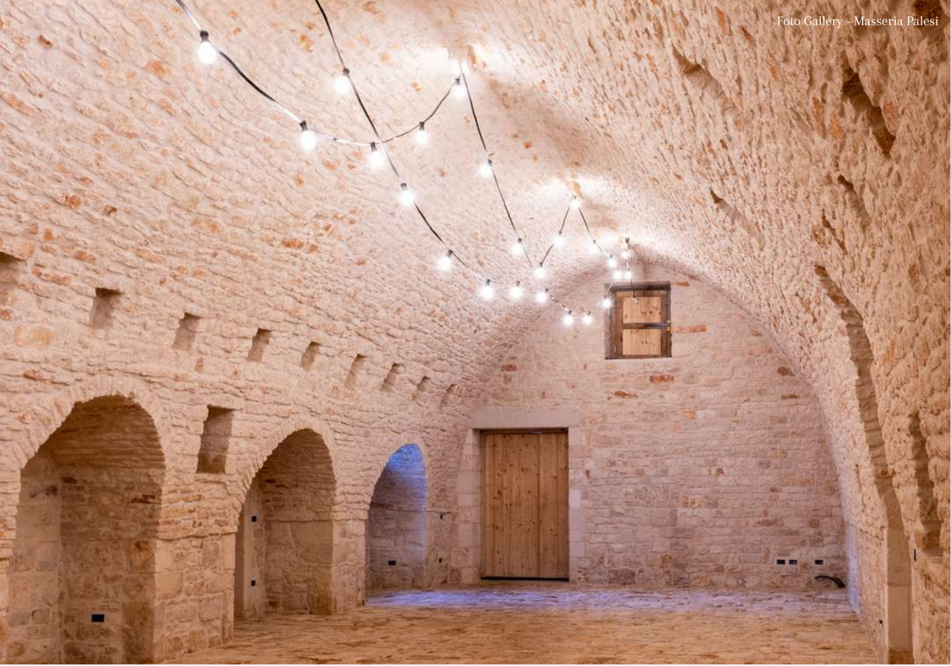
Foto Gallery - Masseria Palesi