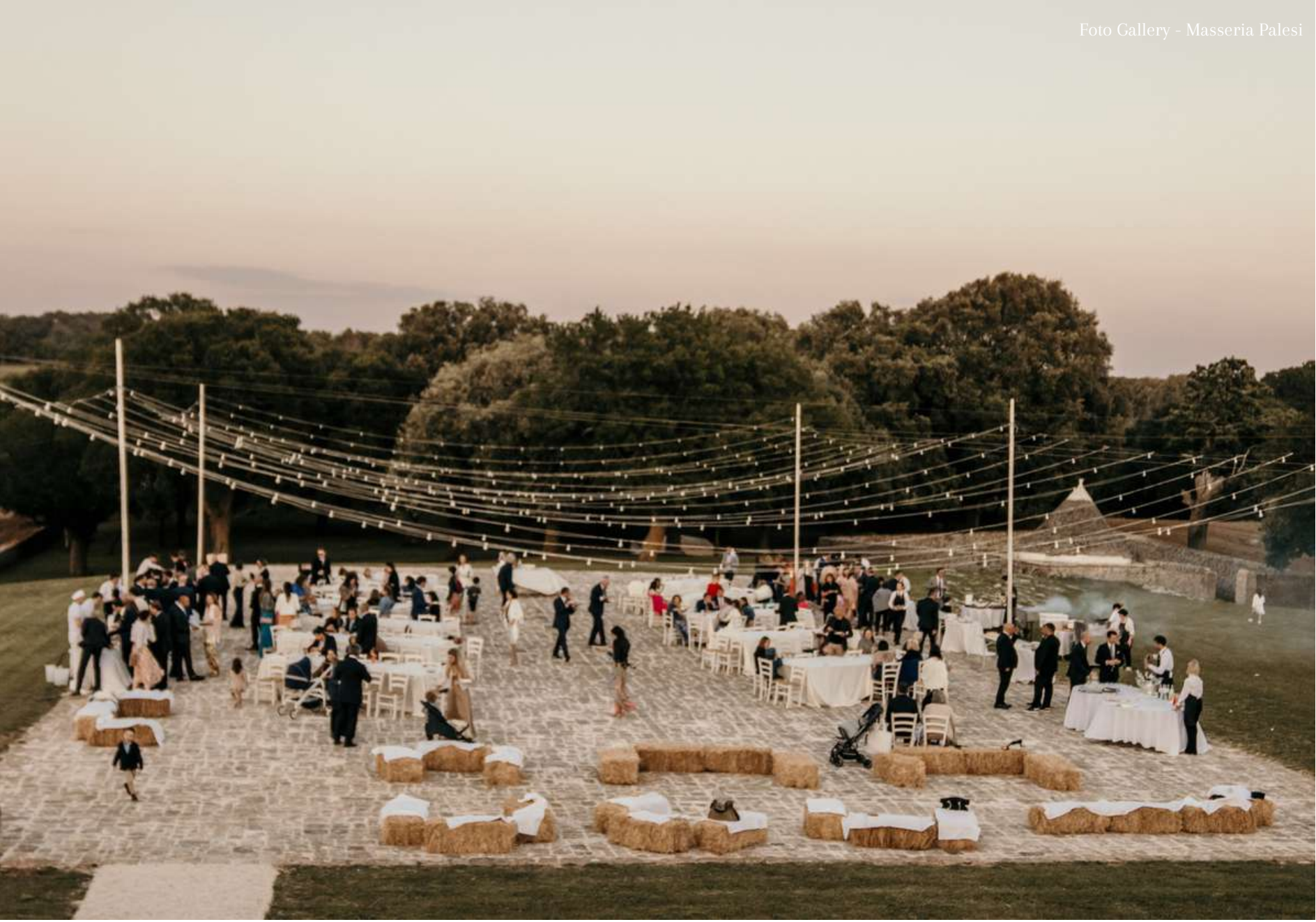
Foto Gallery - Masseria Palesi