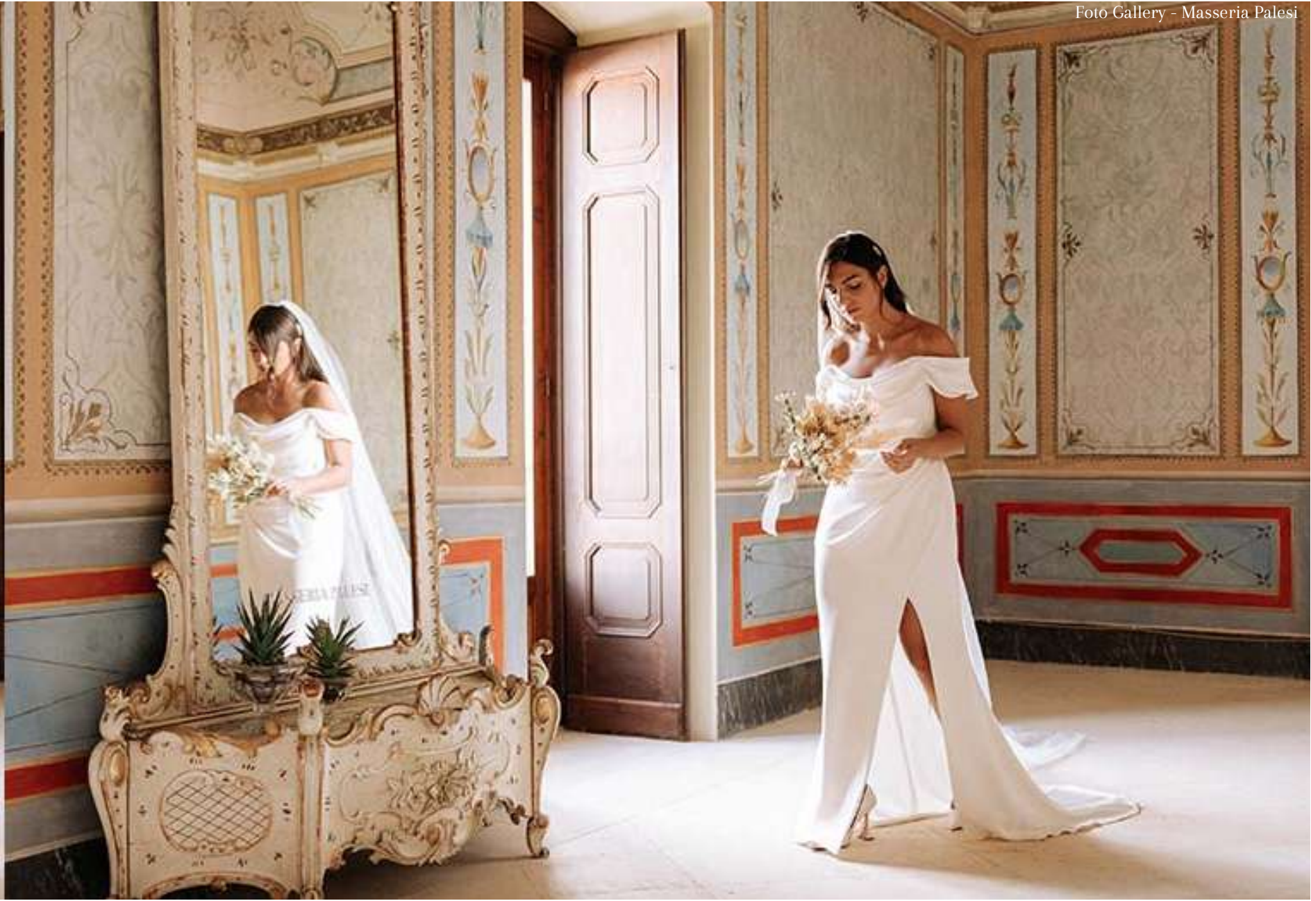
Foto Gallery - Masseria Palesi