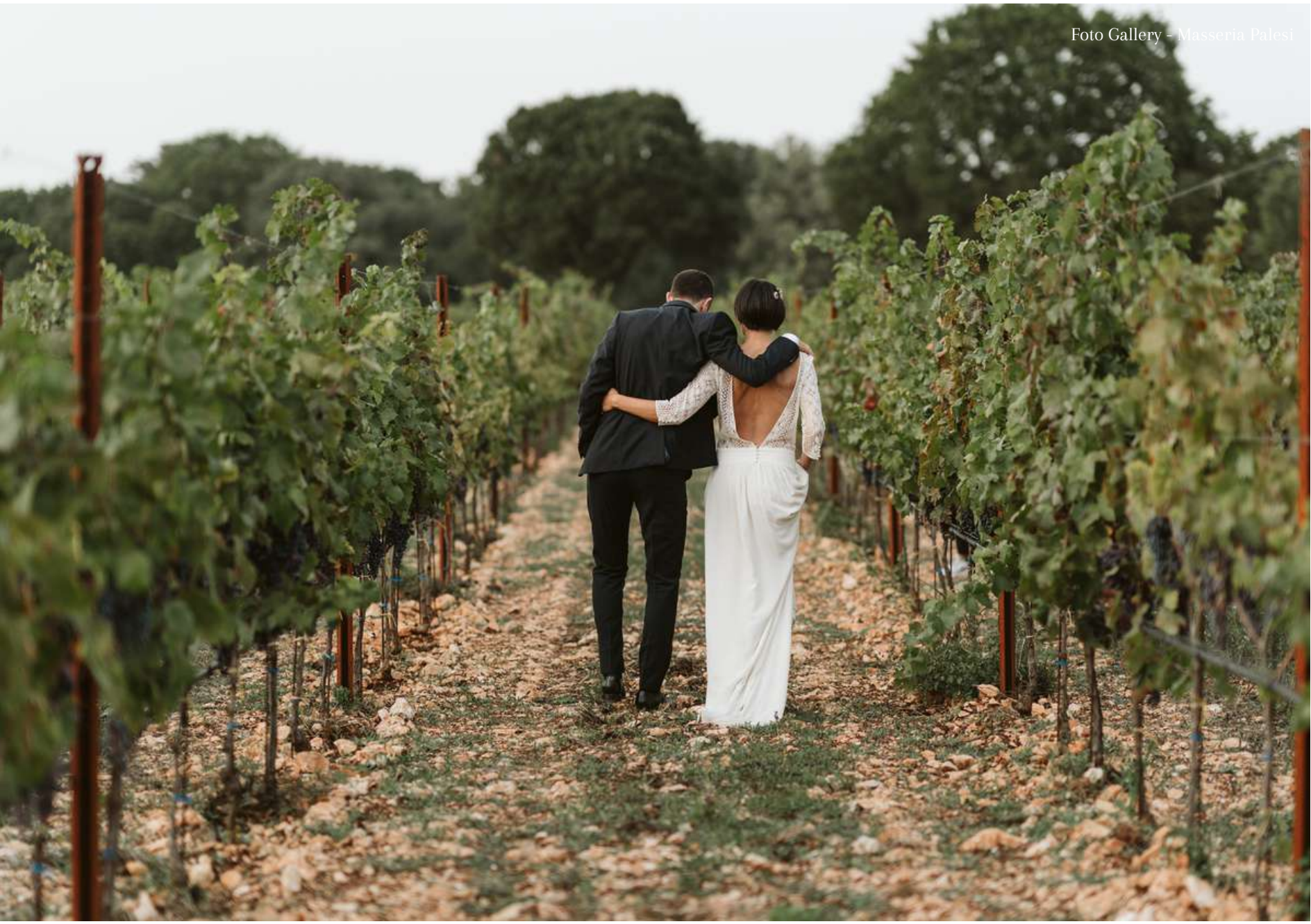
Foto Gallery - Masseria Palesi