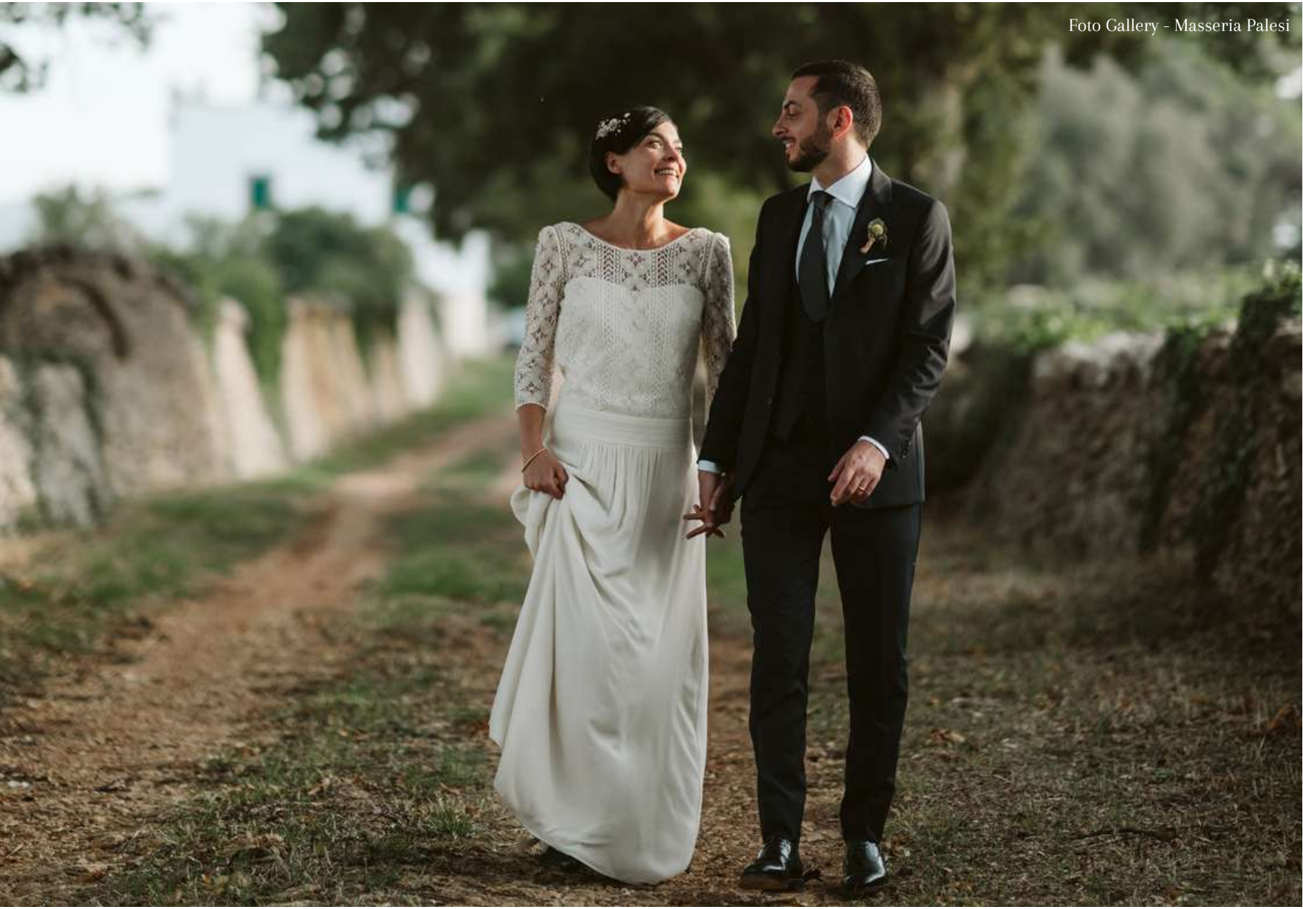
Foto Gallery - Masseria Palesi